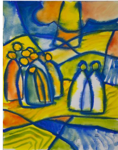
„Die Himmelfahrt Jesu“ Bild: Manuela Steffan In: Pfarrbriefservice.de

Dorothee Sandherr-Klemp (zu Apg 1,12-14) aus: Magnificat. Das Stundenbuch 05/2026, Verlag Butzon & Bercker, Kevelaer; www.magnificat.de In: Pfarrbriefservice.de