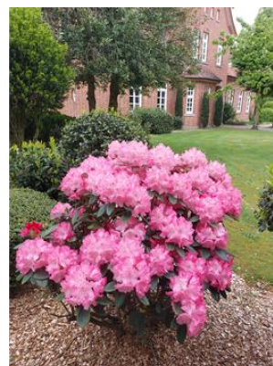
Rhododendronbusch am Pfarrhaus Kl. Berßen

Urbanus am Pfingstmontag um 11:00 Uhr im DGH Gr. Berßen